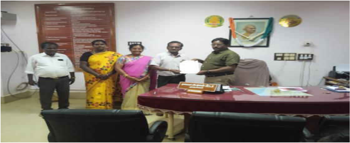
Department of Physical Education Signed MOU with Thanjavur District Powerlifting Organization on 02.09.2024