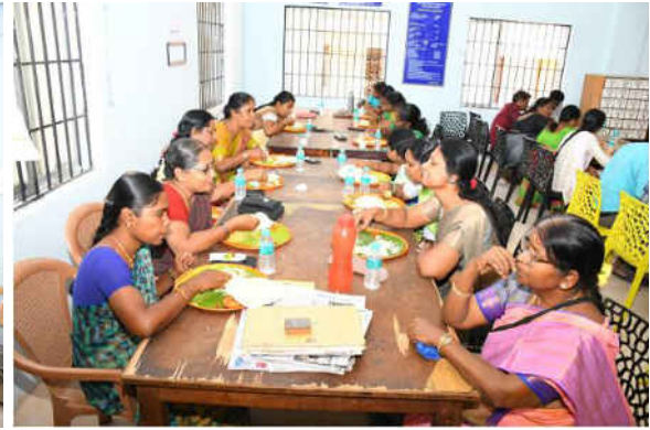
Attendees enjoying the lunch break during the event, fostering networking and engagement