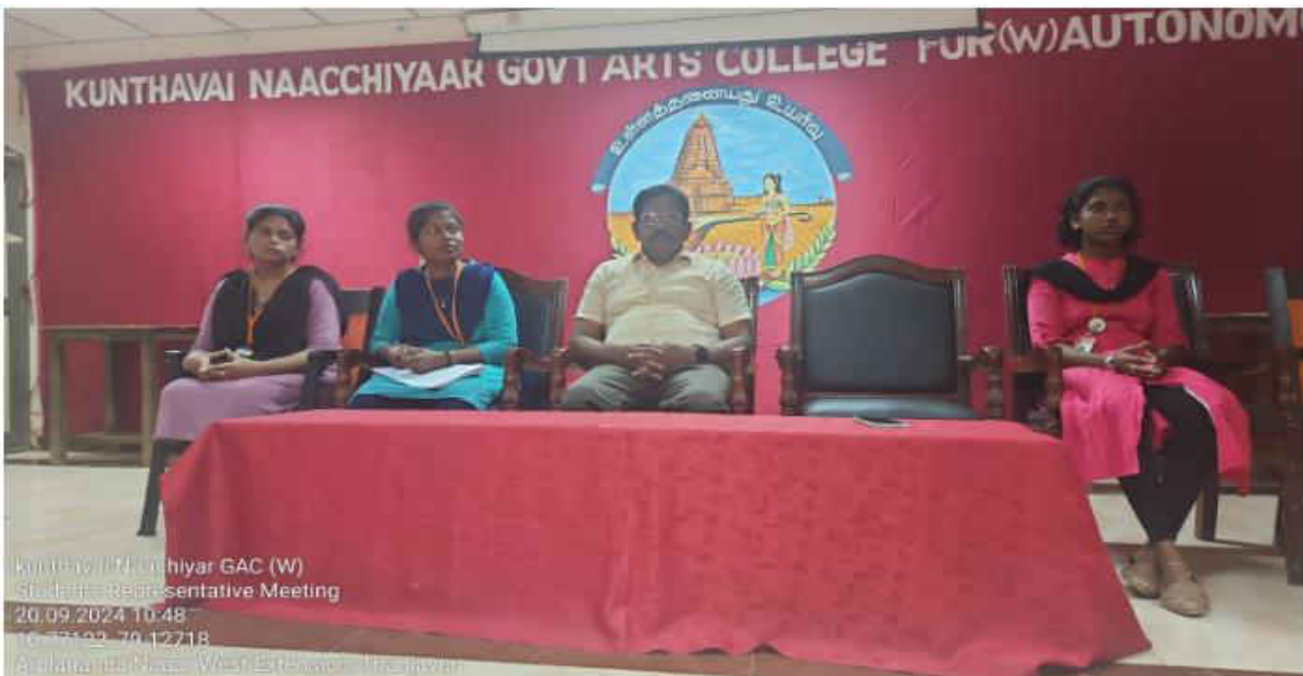
kunthavai Naacchiyar GAC (W) Students Representative Meeting 20.09.2024 10:48 10.77123-79.12718 Arulananda Nagar West Extension, Thanjavur