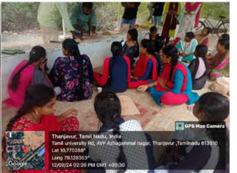
Training, held at the Sculpture Department of Tamil University