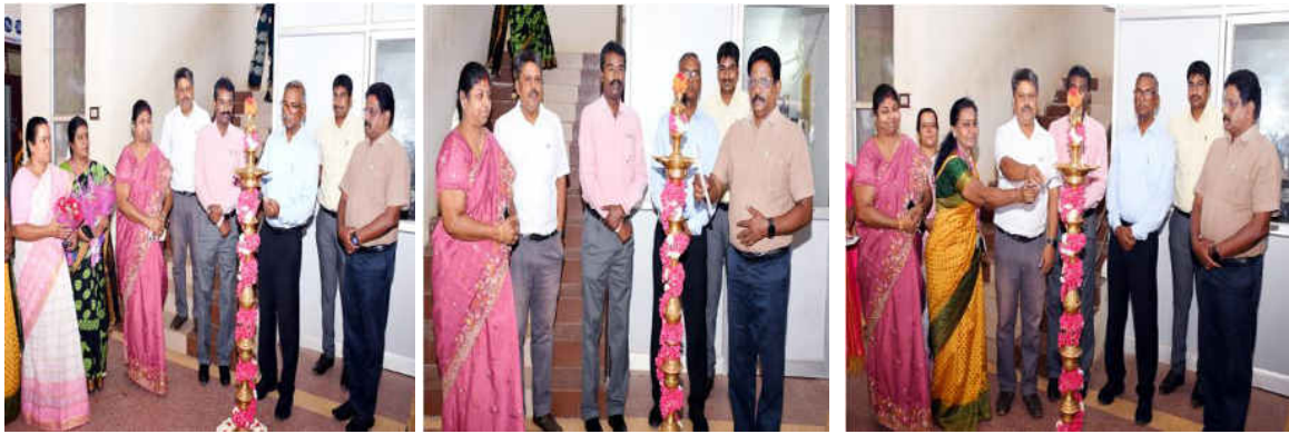
Welcomig the Guest