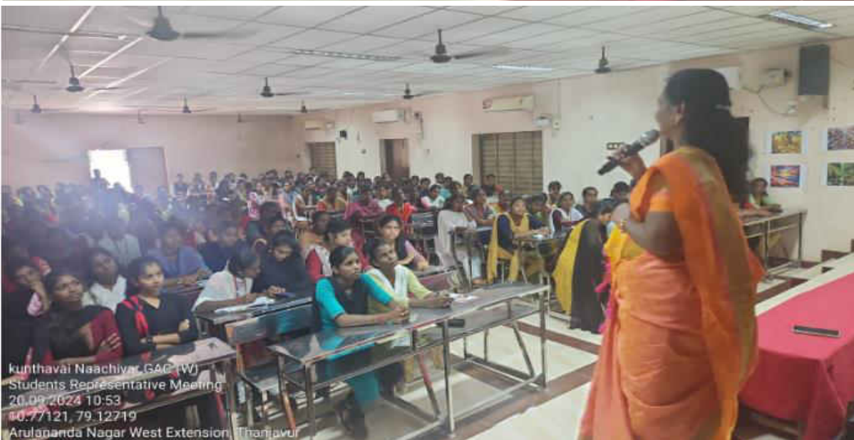
kunthavai Naacchiyar GAC (W) Students Representative Meeting 20.09.2024 10:53 10.77121-79.12719 Arulananda Nagar West Extension, Thanjavur