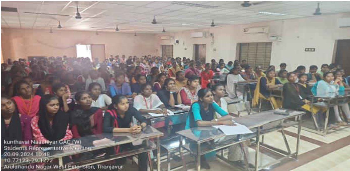
kunthavai Naacchiyar GAC (W) Students Representative Meeting 20.09.2024 10:48 10.77123-79.1272 Arulananda Nagar West Extension, Thanjavur