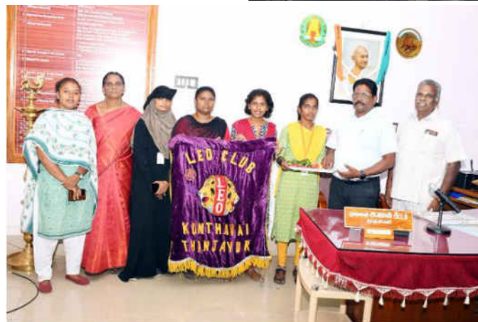
Rotaract coordinators and Leo Club students congratulated the Principal on Teachers' Day