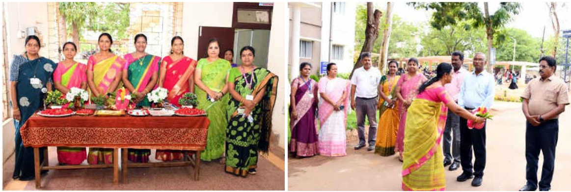
Principal Honour the Guest with Bouquet