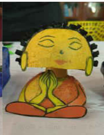
Students displayed the products made from Best out of Waste