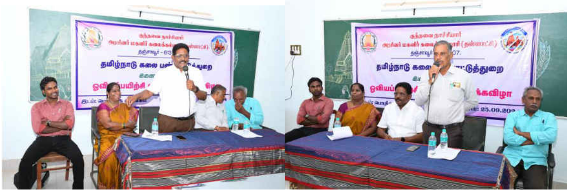
Principal delivered a presidential address