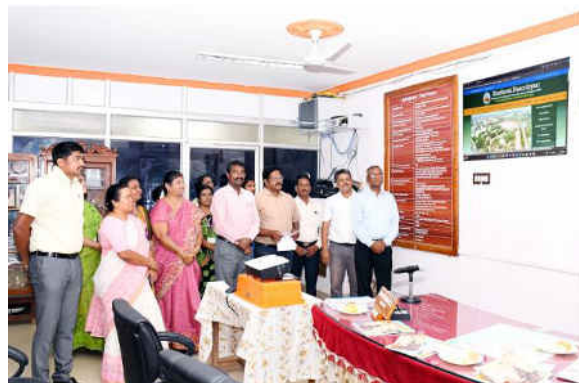
New Website Launching