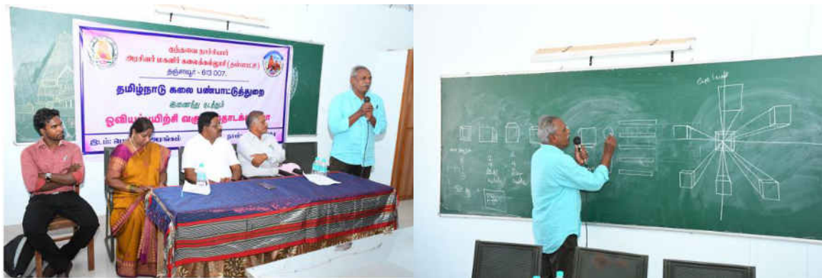
Resource person deliver a speech