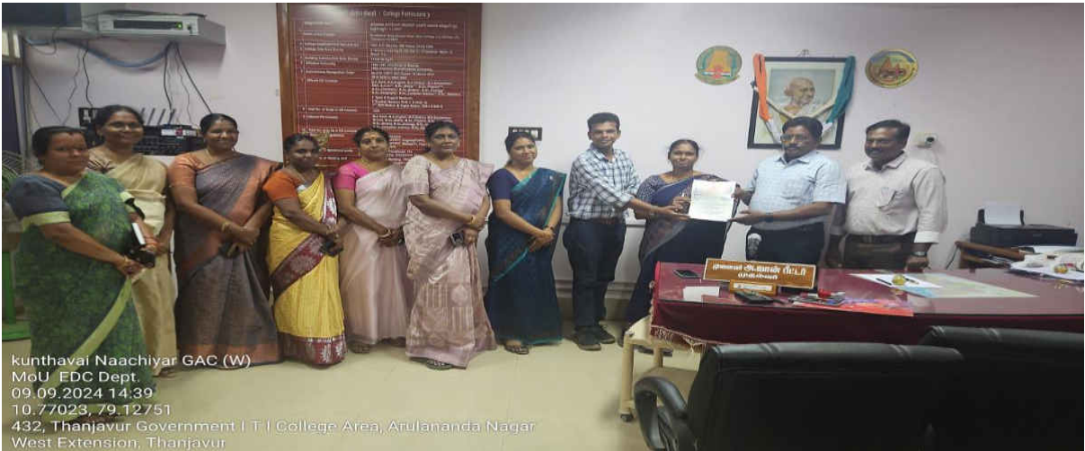
EDC signed MoU with Do Design Thanjavur