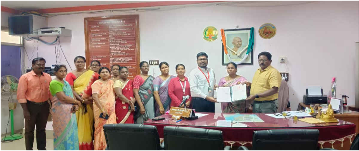
EDC signed an MoU with Synergy School of Business Skills, Thanjavur