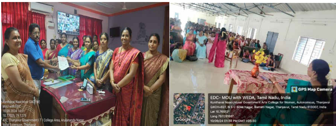
EDC signed a third MoU with the Women Entrepreneur Development Association