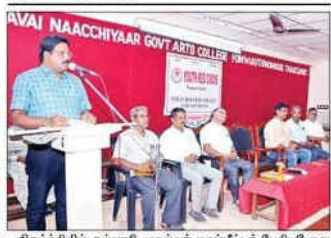
நிழர்ச்சியில் கல்யாணி முதல்வர் ஜார்ஜ் பீட்டர் பேசியபோது மாடுதப்பட்டம்.