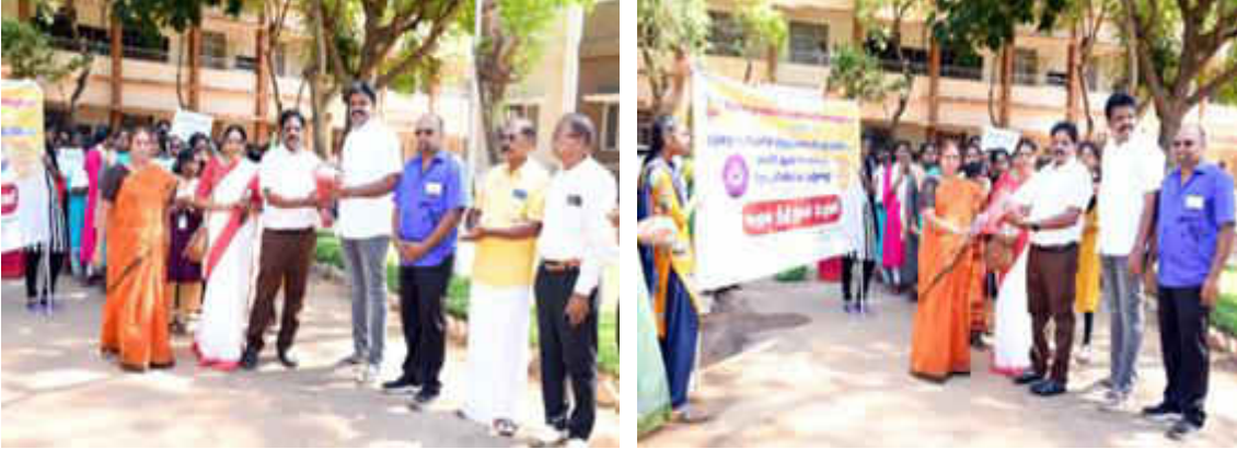
Principal honoring the Chief guests