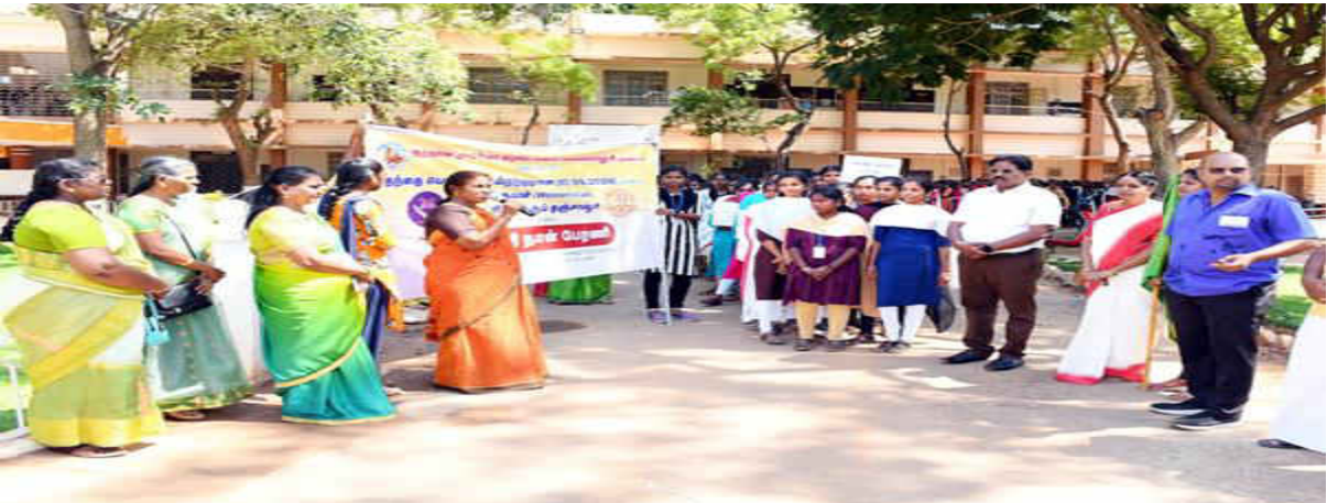
Dr. Rosie providing the keynote address