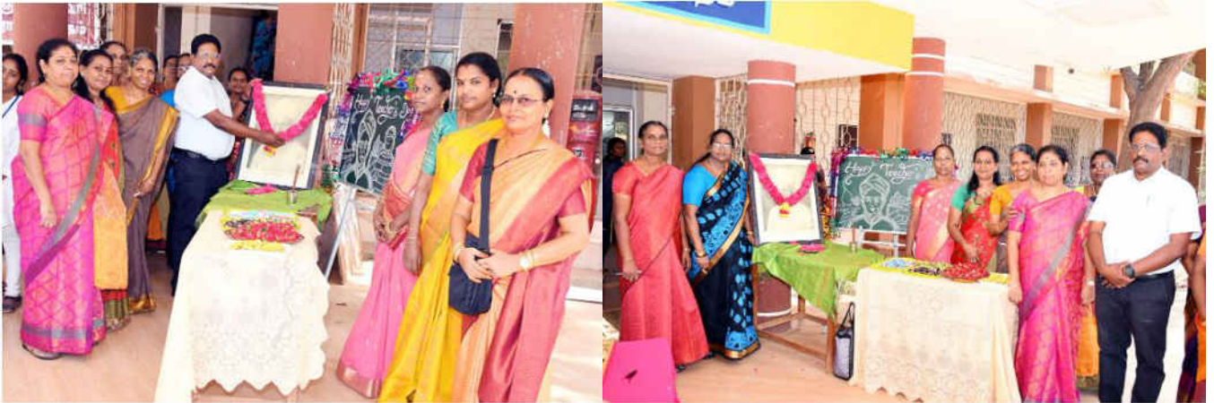
Principal and teachers paid their respects by sprinkling flowers