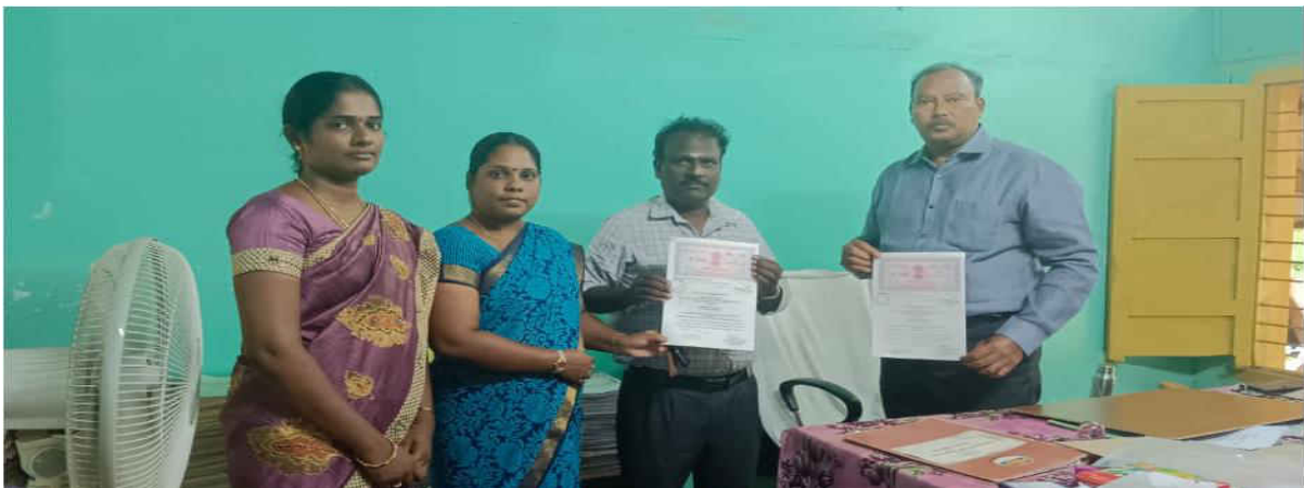
Department of Chemistry Signed MOU with Arignar Anna Sugar Factory, Kurugulam on 06.09.2024