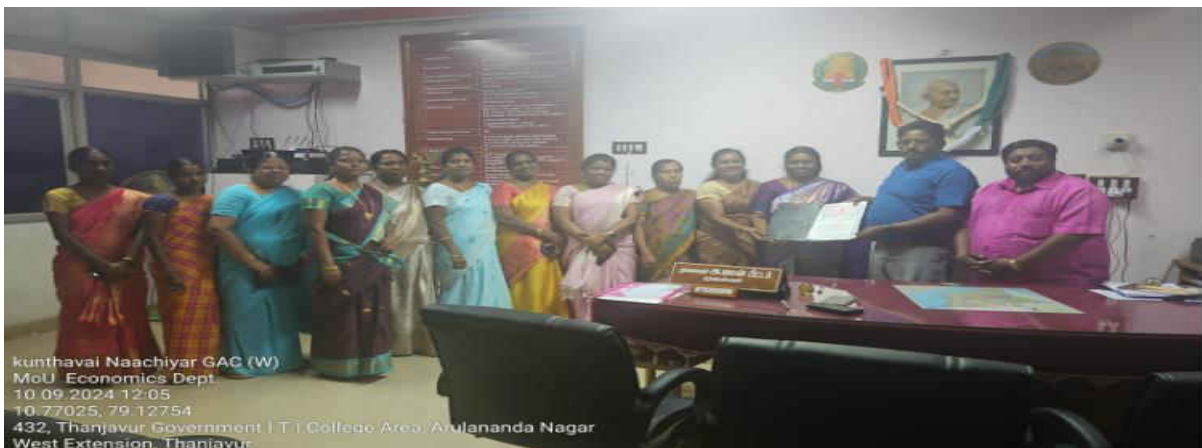
Department of Economics Signed MOU with Women Entrepreneur Association of Tamil Nadu DIC Thanjavur on 10.09.2024