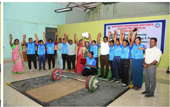
Kunthavai Naachiyar College won the overall championship