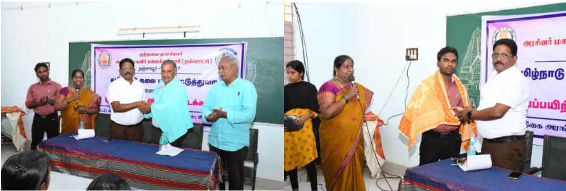
Principal Honouring the Chief Guests