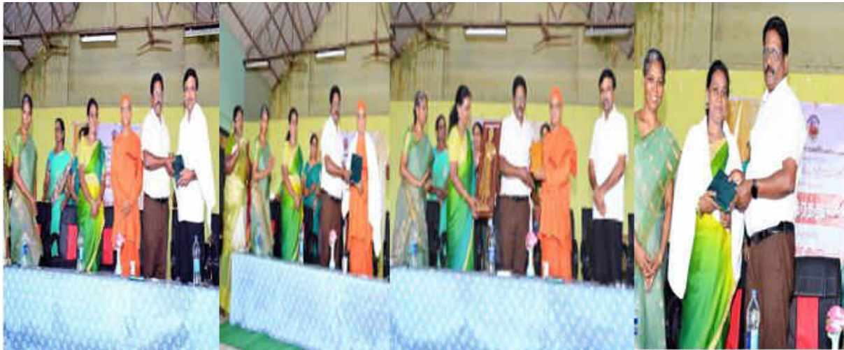
Principal Honour the Dignitaries