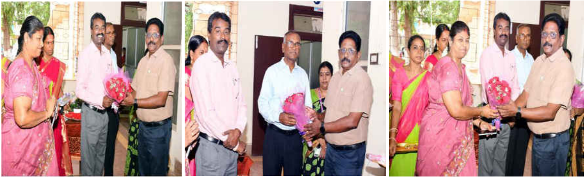
Lighting the Lamp