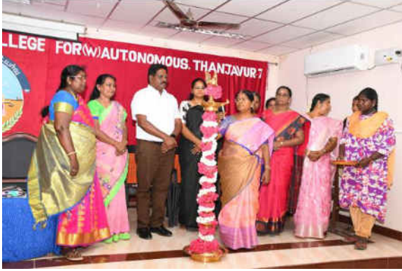
Lighting the lamp by Dignitaries